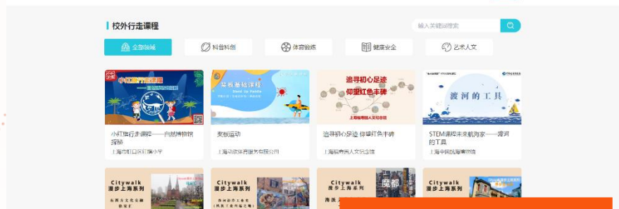
课程平台展示效果